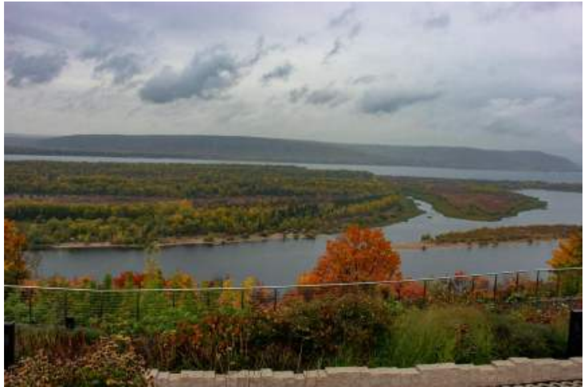
Национальный парк «Самарская Лука»

Важными аспектами являются экологическое воспитание и образование, для рядового гражданина реализованное через упомянутые экотуры и прохождение экотроп.