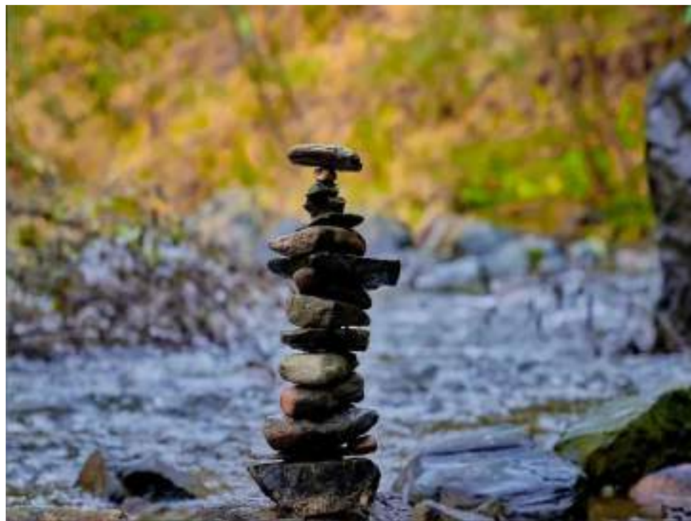
Экотропы Кавказа, 2023 г.