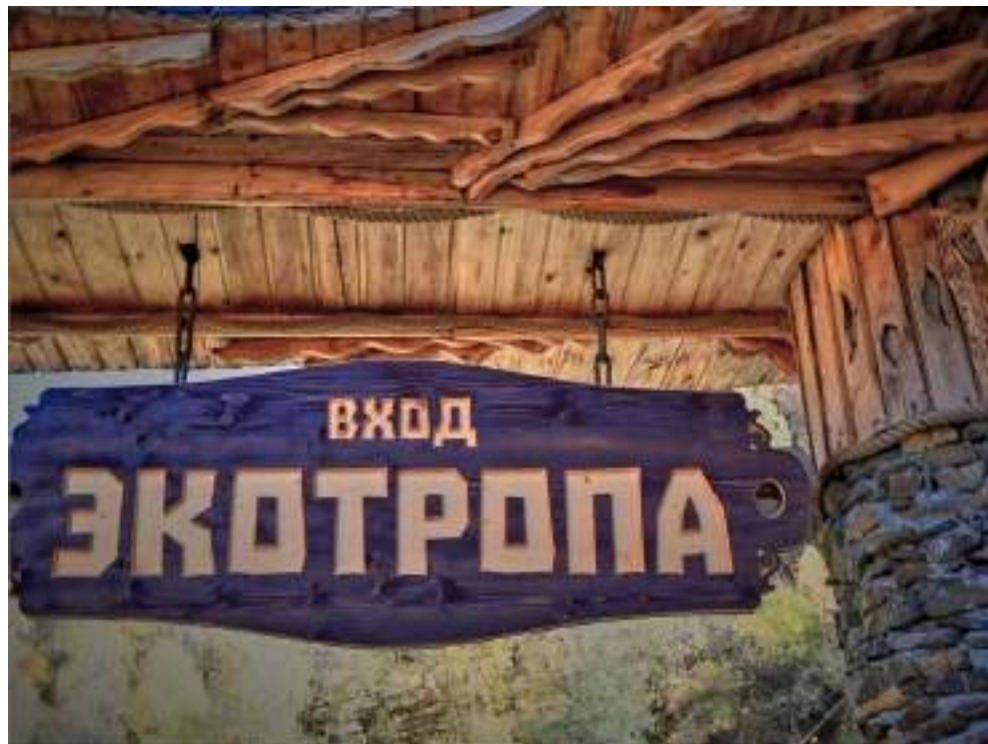
Экотропы Кавказа, 2023 г. фото СФК «Новатор»