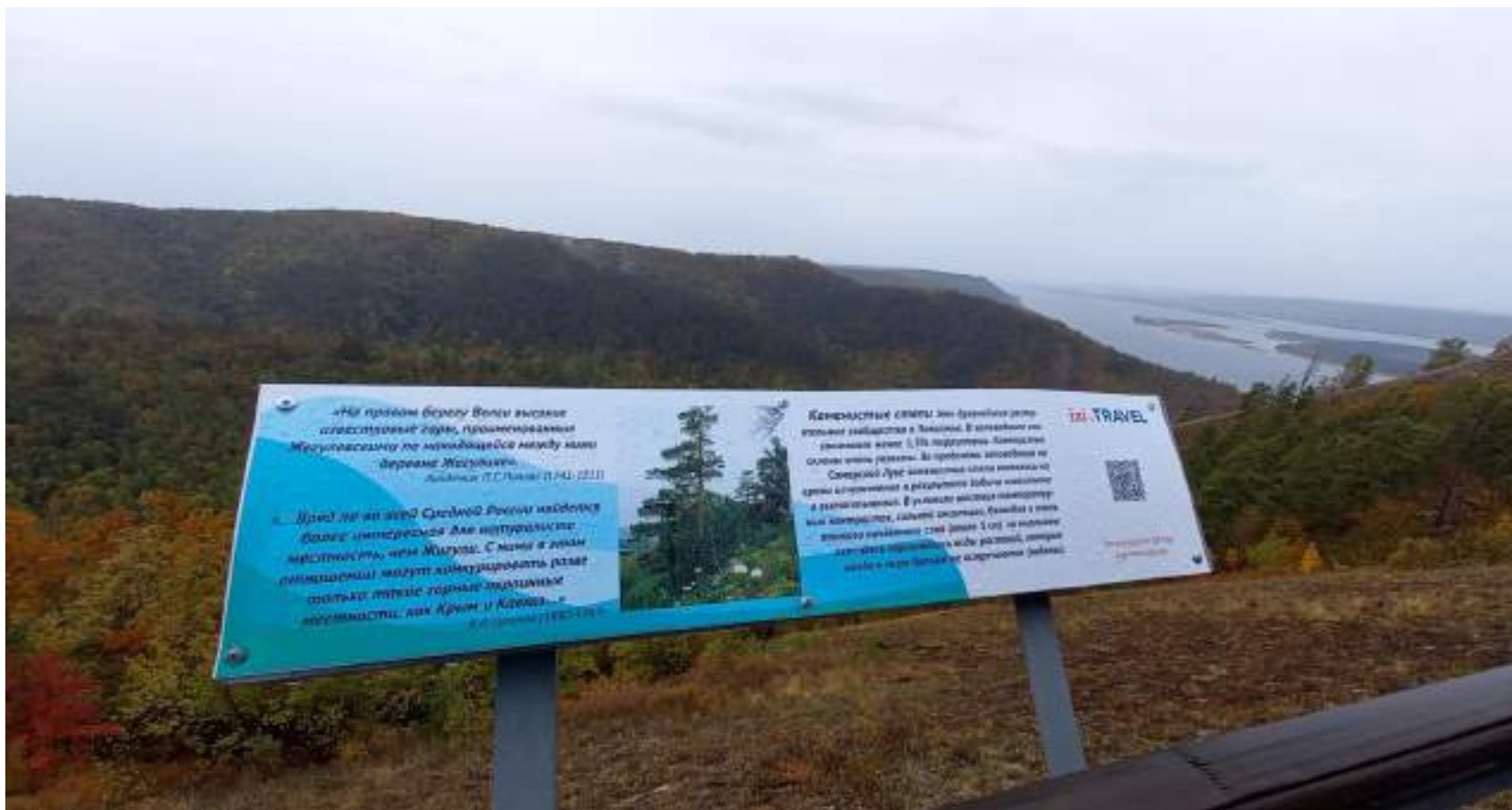
Национальный парк «Самарская Лука»

«Формат экотропы позволяет туристам побывать в заповедных уголках ООПТ, но свести к минимуму вред, который человек может нанести дикой природе. Решить проблему возведения и эксплуатации экотроп могло бы закрепление правового статуса «тропы».